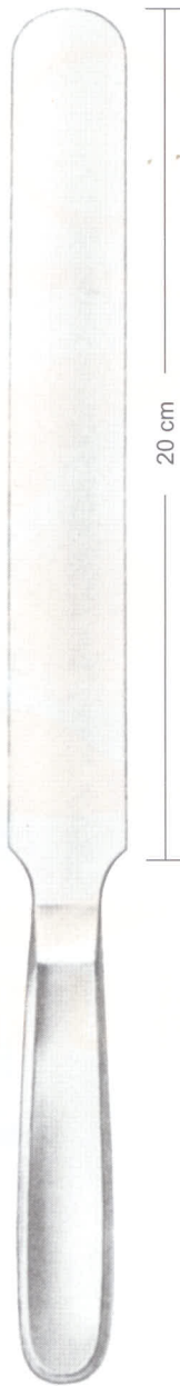
VIRCHOW 02-093-335 33.5 cm