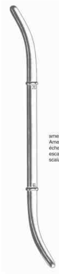
amerikanische Skala American scala échelle américaine escala americana scala americana