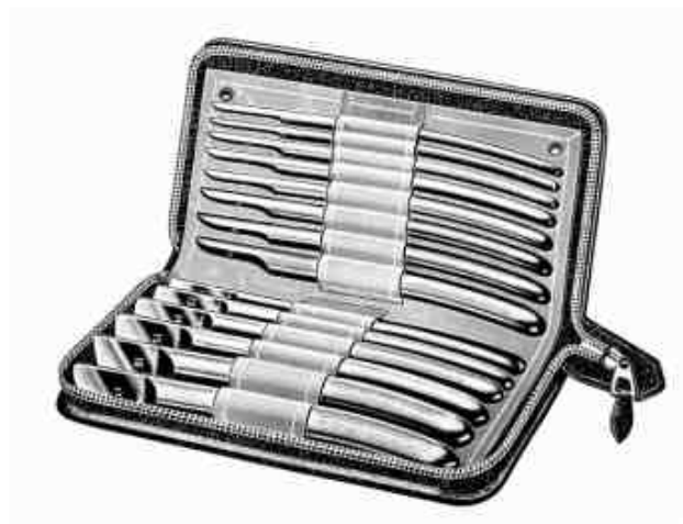
HEGAR 70.405.14 4-17 mm 14 Stück/ea./pces./c.u./pezzi